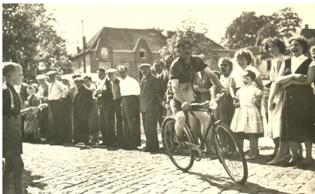
Wielervedstrijd in Pamel rond 1930