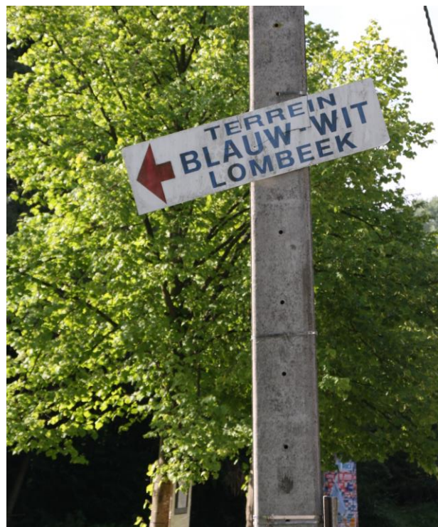
Vergane glorie: aan de ingang van het vervalten terrein 'den Broebel' herinnert nog een vergeten richtingwijzer aan het terrein waar de carrière van Franky begon.

Het kon niet uitblijven, Franky werd ook opgeroepen voor de nationale ploeg. Slechts twee voetballers zouden meer matches spelen voor de Rode Duivels (86!). Hij maakte ook deel uit van de legendarische ploeg die vierde eindigde op het wereldkampioenschap in Mexico. Franky heeft ook nog eens twee gouden schoenen mee naar huis mogen nemen (1990 en 1996). Voetbalgod Pelé heeft ooit een boek samengesteld met de (volgens hem) beste honderd voetballers. Daarin staan maar drie Belgen: Jean-Marie Pfaff, Jan Ceulemans en ... Franky Vander Elst.