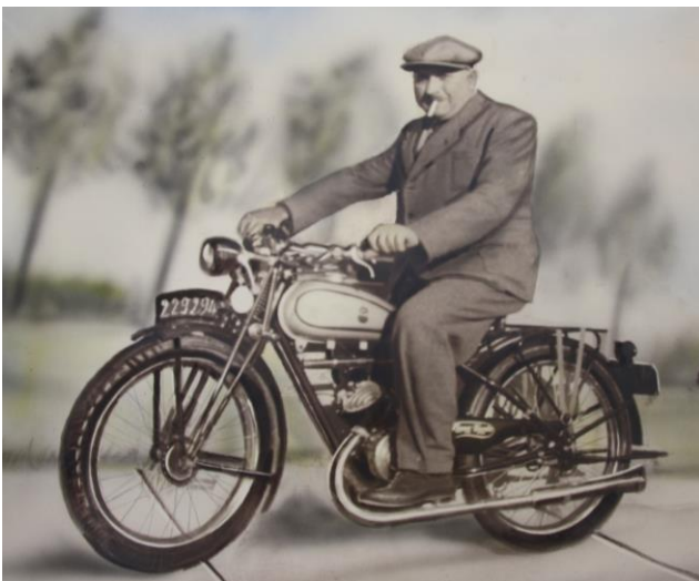
Remi Barbé op latere leeftijd, fier poserend op een van zijn motoren.

In de periode 1912-1914 stimuleren de populariteit en successen van Marcel Buysse als profwielrenner op de weg en op de piste